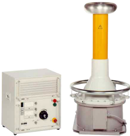
Ilustración a modo de ejemplo