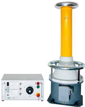
Ilustración a modo de ejemplo